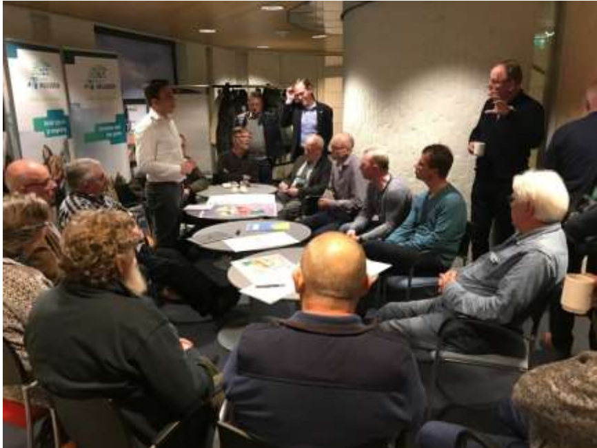
Figuur 2 - Opstelling bij thematafels