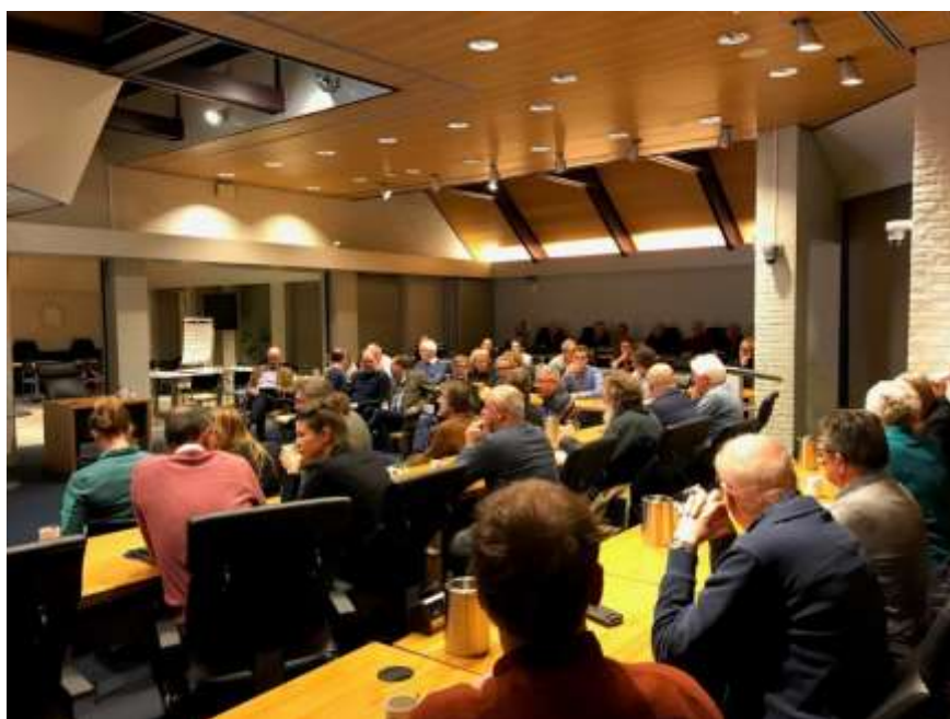
Figuur 1 - aanwezigen bij informatieavond

De avond werd opgedeeld in drie onderdelen: een plenaire opening en inleiding, toelichting aan thematafels en een plenaire terugkoppeling.